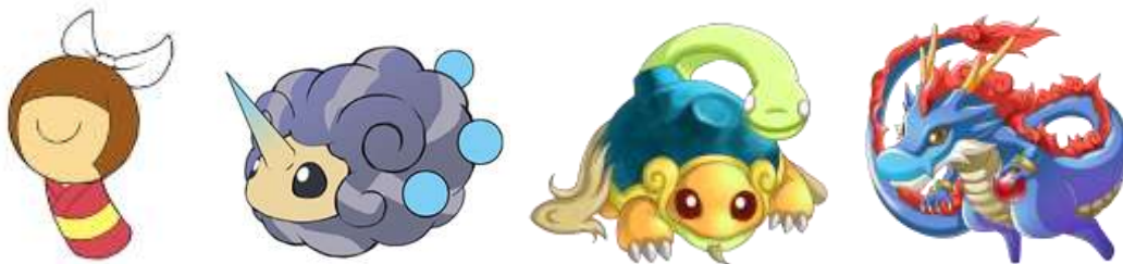
他にもカワイイ担当の「プリヒナ(ラフ画)」や「ライウール(ラフ画)」、そして、強力なスキルを持った聖獣も登場します！