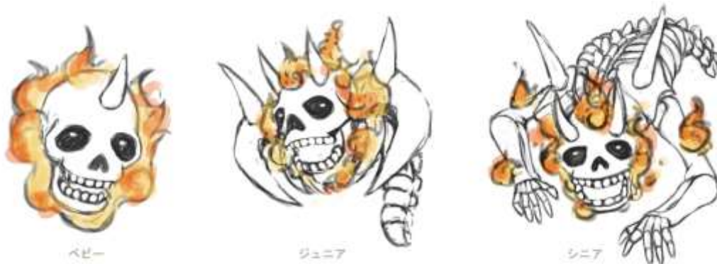
泣く子も黙る、コワモテ担当「ヒドクロ(ラフ画)」