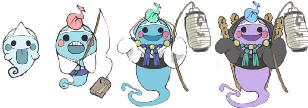
ニホンのおバケといえばこれ！ユーレイの「ウラミー(ラフ画)」

「おばけおけば OK!」ではニホン各地のおバケたちが登場いたします。ローンチ時は 30 種 150 体を予定しておりますが、今回、未発表のキャラクターの一部をご紹介します。